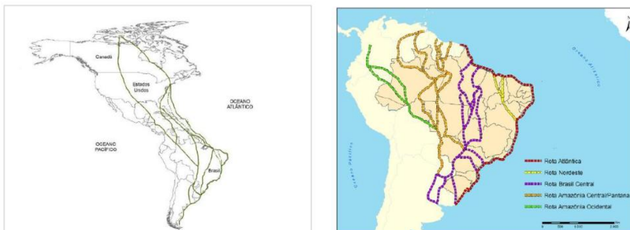
Mapas das principais rotas de aves migratórias nas Américas e no Brasil.

No dia 15/10/2019, a SESAPI confirmou o 4º caso de doença neurológica pelo vírus do Nilo Ocidental no Piauí. O caso corresponde a uma jovem que sofreu quadro de meningoencefalite grave, sobreviveu e ainda mantém tratamento ambulatorial. Não foi possível definir com exatidão o local provável de infecção, pois a paciente esteve em três municípios durante o período de incubação estimado para a doença: Teresina, Lagoa Alegre e Cabeceiras. Até o momento, casos humanos de febre do Nilo Ocidental só foram registrados no estado do Piauí, mas casos em cavalos já foram confirmados nos estados do Espírito Santo (2018), Ceará (2019) e São Paulo (2019). O Piauí situa-se em rota de aves migratórias intercontinentais, o que pode contribuir para a ocorrência de casos (figura).