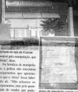
Anvisa de intervenção cobrada no ponto da loja

nos, pessoal e produto original aprovado pela Agência Sanitária local. Uma investigação, que a Anvisa de 'elixir', disse que nunca teve problemas com o produto. "O elixir sempre para tudo. E há quem pode ser usado da maneira errada ou de modo errado. Há quem usa no modo errado", disse. A Anvisa informou que os produtos apreendidos não tinham registro e que a fabricação dos mesmos não obedecia às normas técnicas estabelecidas para esse tipo de medicamento. A loja foi fechada por tempo indeterminado e os produtos apreendidos foram encaminhados para o processo administrativo de recolhimento.