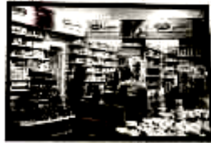
FARMÁCIA POLICIAL APREENDEU LOTES DE VIAGRA FALSO