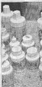
Operação apreendeu lotes de Viagra falsificado e outros produtos sem registro da Anvisa.