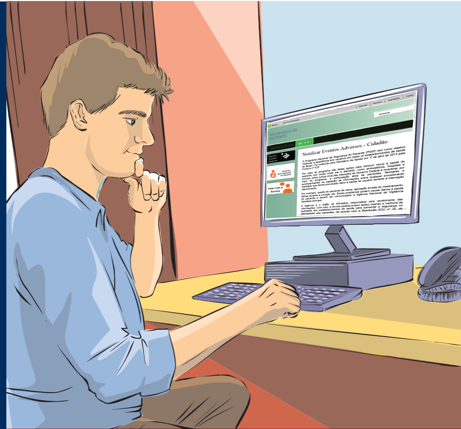
PACIENTE, FAMILIAR OU ACOMPANHANTE