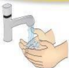
Higienização das mãos