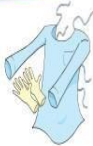
Luvas e Avental