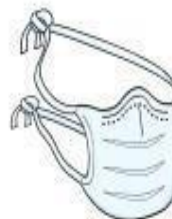
Máscara Cirúrgica (paciente durante o transporte)