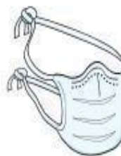
Máscara Cirúrgica (paciente durante o transporte)