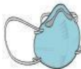
Máscara PFF2 (N-95) (profissional)