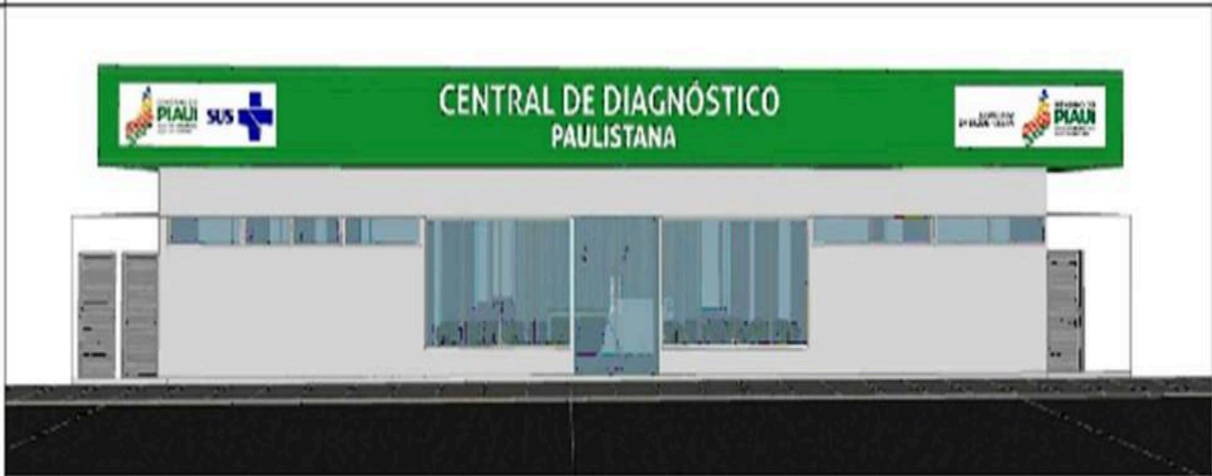
FACHADA PRINCIPAL Sem escala